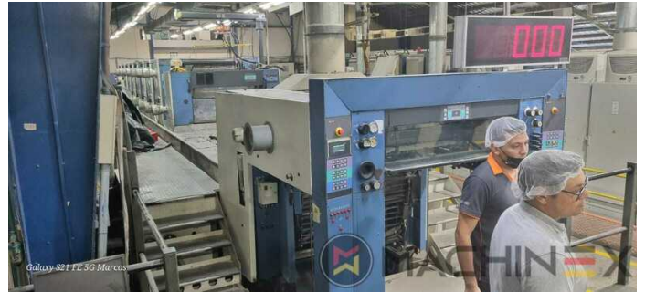
Galaxy S21 FE 5G Marcos