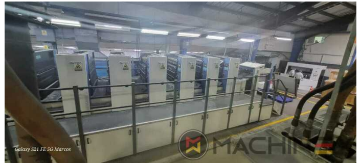
Galaxy S21 FE 5G Marcos