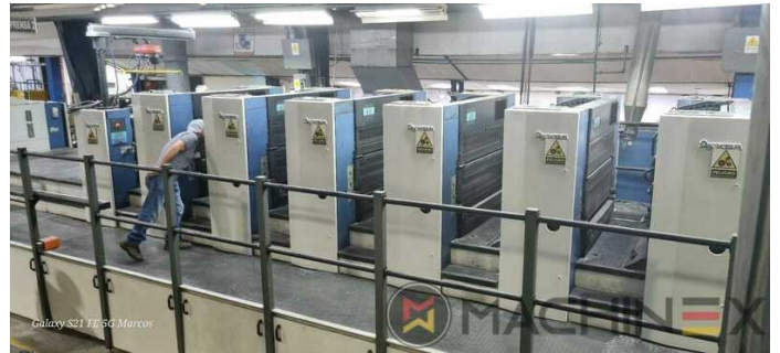
Galaxy S21 FE 5G Marcos