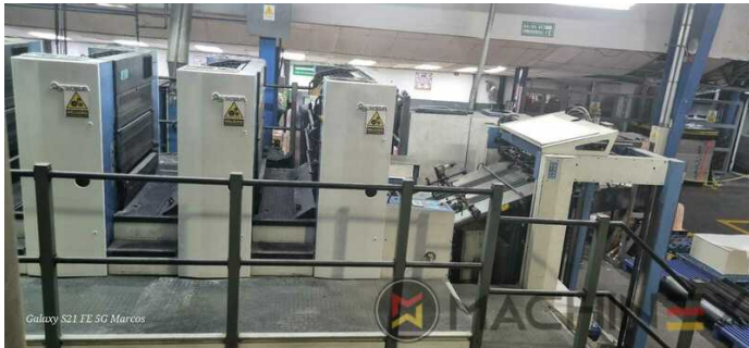
Galaxy S21 FE 5G Marcos