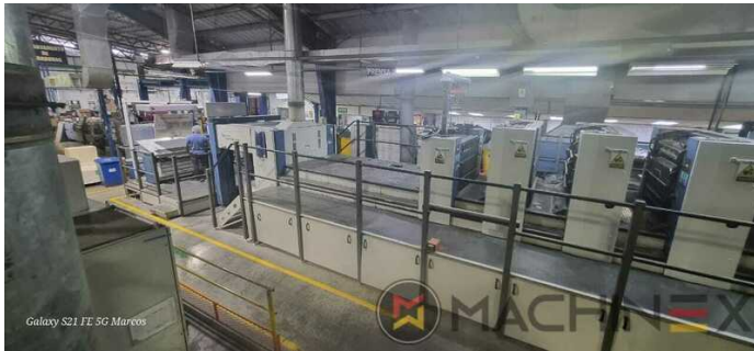
Galaxy S21 FE 5G Marcos