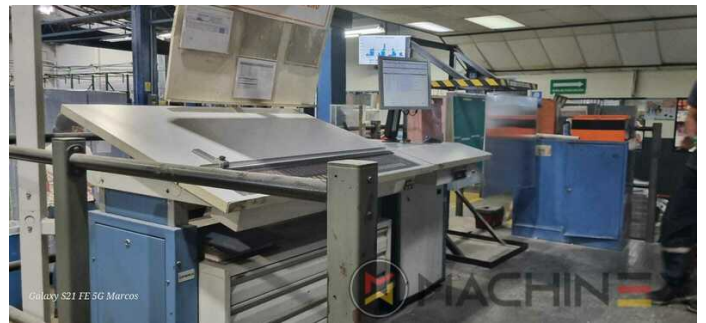
Galaxy S21 FE 5G Marcos