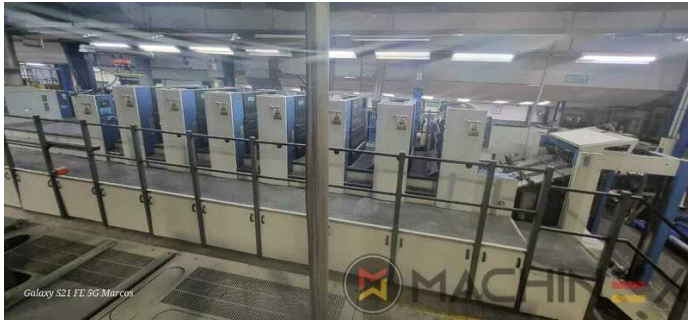
Galaxy S21 FE 5G Marcos