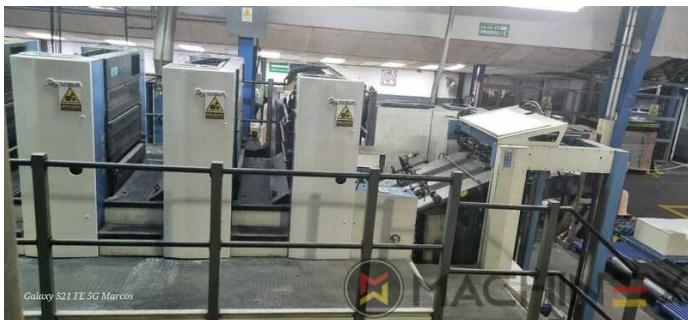
Galaxy S21 FE 5G Marcos