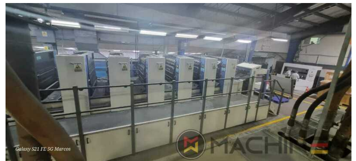
Galaxy S21 FE 5G Marcos