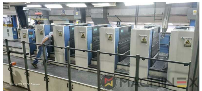
Galaxy S21 FE 5G Marcos