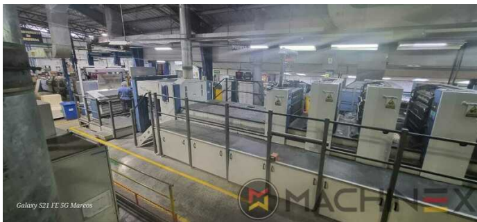
Galaxy S21 FE 5G Marcos