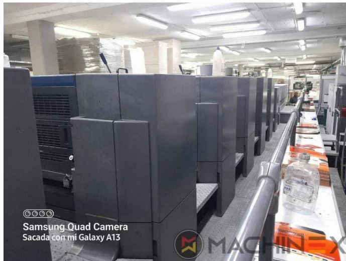
©©©© Samsung Quad Camera Sacada con mi Galaxy A13