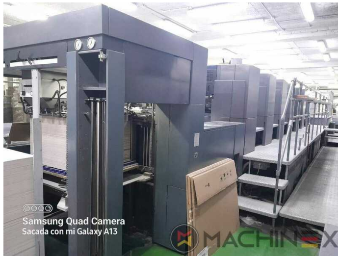
©©©© Samsung Quad Camera Sacada con mi Galaxy A13