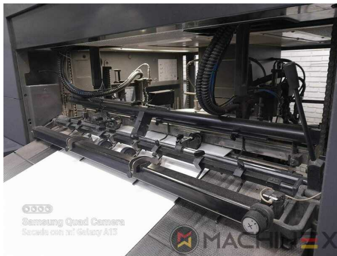
©©©© Samsung Quad Camera Sacada con mi Galaxy A13