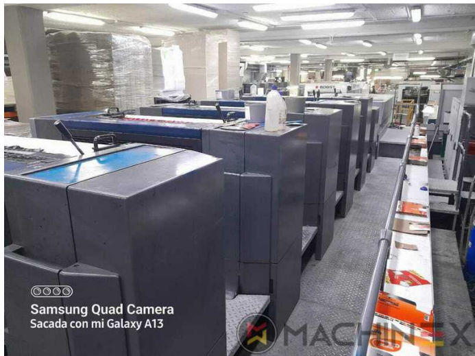
©©©© Samsung Quad Camera Sacada con mi Galaxy A13